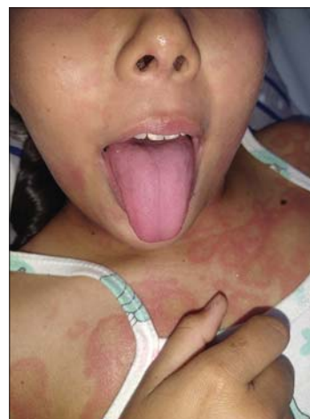
Figure 2: Strawberry tongue.